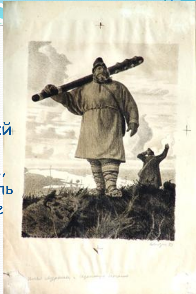
Иллюстрация Кибрика Е. А. «Илья Муромец и Идолище Поганое» (1950 г.)

Хан, принятый в городе с почётом, держался надменно, как победитель среди побеждённого народа. Бояре советовали разделаться с пришельцами. Княжеские дружинники напали ночью на половецкий стан и освободили Святослава, перебив его охранников. А утром был убит и хан Итларь.