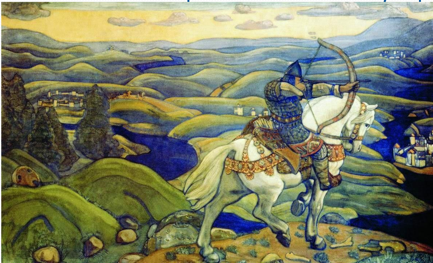
Рерих Н. К. «Илья Муромец», 1909-1910

Защита Святослава : Обязанность телохранителя принял на себя Илья Муромец. Он проник в половецкий стан в обличье «калики перехожего» — нищего богомольца. В решающий момент ночной схватки Илья закрыл собой княжеского сына от приставленных к нему стражей.