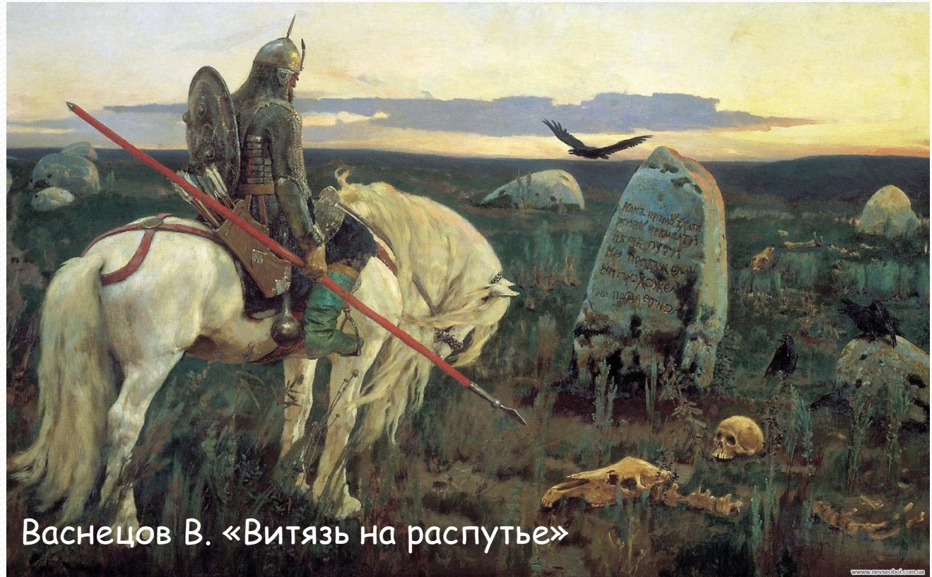
Васнецов В. «Витязь на распутье»

Илья Муромец был убит в рукопашной схватке. Левая рука опытного бойца отреагировала на выпад копьем и пыталась отбить удар. Но в этой руке не было щита, и смертоносное оружие пронзило её, и незащищённое тело до самого сердца. Киево-Печерская обитель в XII в. славилась богатствами, привлекавшими грабительские шайки разного рода. С одной из таких шайк и столкнулся, по всей видимости, прославленный богатырь.