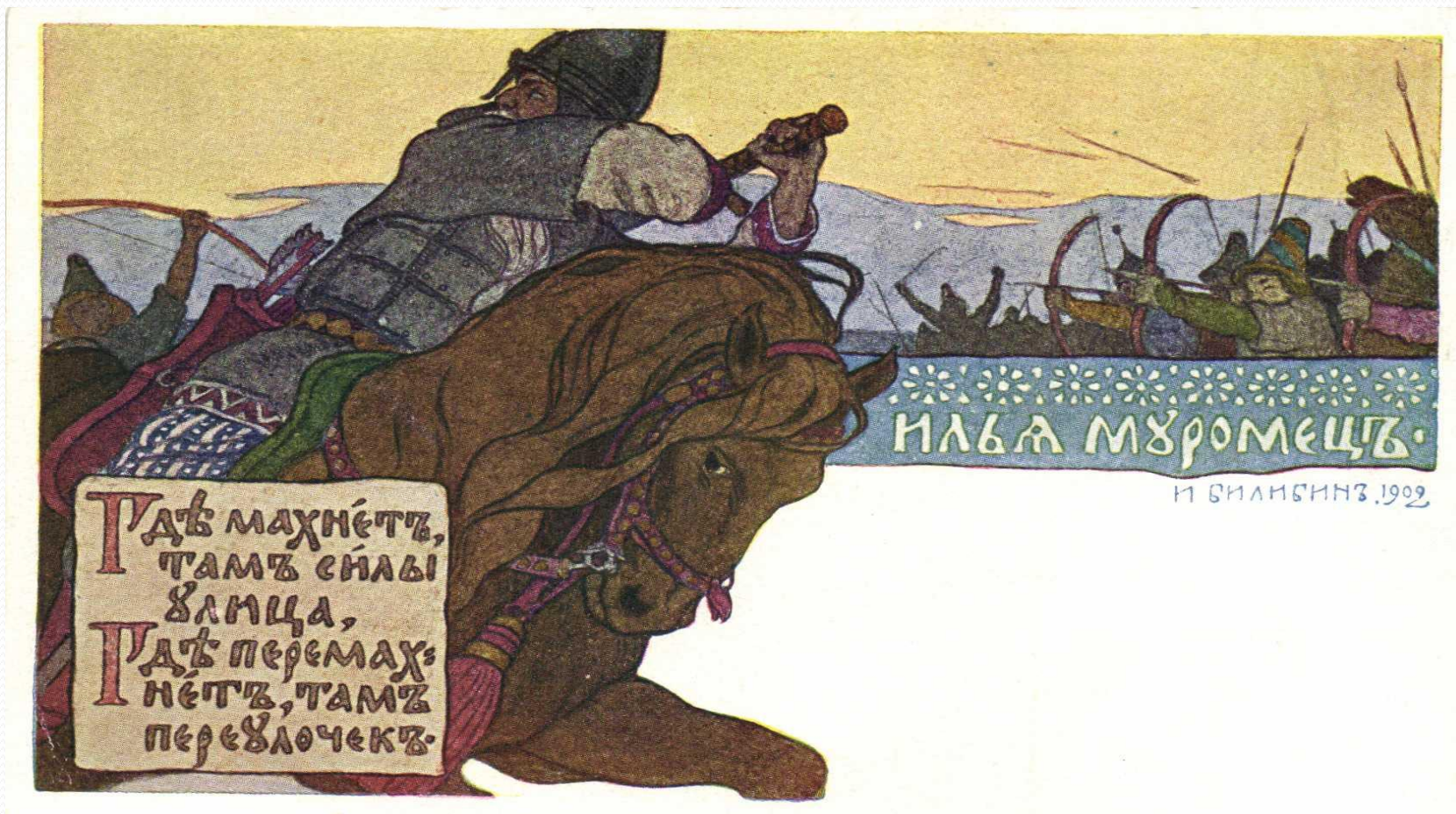
Билибин И. Я. Илья Муромец (из серии "Богатыри") 1902. Открытка издания "Общины св. Евгении"

Мономах уступил город врагу-родственнику и отправился в Переяславль с семьей и дружиной. Дстойное место в этой отборной дружине (ок. 100 воинов) занял воин Илья — простолюдн из города Мурома.