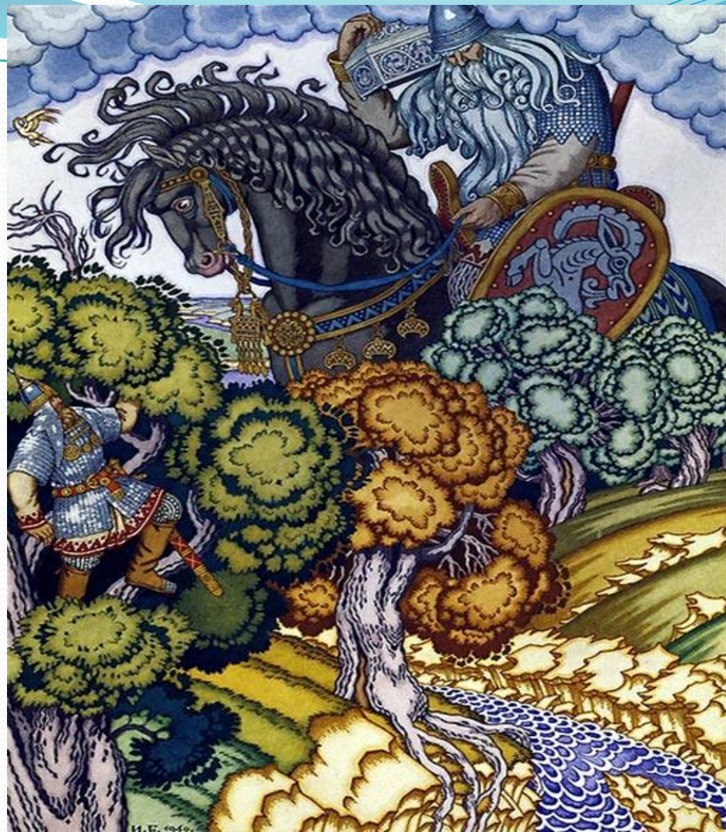
Билибин И. Я. «Илья Муромец и Святогор», 1940

Мономаху удалось объединить большинство русских княжеств в единый союз. Войска русских князей отбили натиск половцев. Илья Муромец участвовал во многих боях и походах, но не выслужил «хлеба мягкого» — высоких должностей. А потому и не попал в летописи. Но и рядовым воином богатырь не остался. Его назначили командиром станицы — небольшого отряда, дислоцированного на одной из пограничных застав. Станичники следили за степью, отражали набеги малых половецких ватаг. В больших походах станица Ильи Муромца исполняла функции разведки, добывала языков, уничтожала вражеские сторожевые посты.