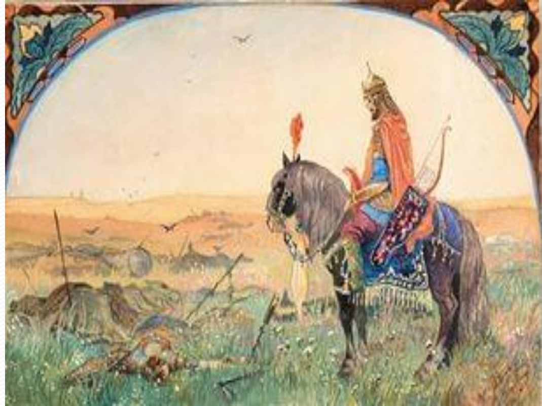
Каразин Н. Н. Иллюстрация к былине „Илья Муромец“, 1906 г. картон, акварель

Илья Муромец служил Владимиру Мономаху. В 1093 г. Мономах в Чернигове срочно собирает новое войско против половцев. На первую свою войну Илья отправился в составе воинского контингента, выступившего на помощь Мономаху из Мурома, который входил в состав Черниговского княжества. Вражеской силой были половцы, которых привёл русский князь Олег Святославич.