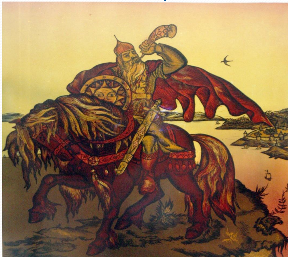
Шитиков Е. П. «Илья Муромец», 1981 г.

Бояре кинулись к Мономаху, умоляя его о защите. И, как только новый великий князь появился в Киеве, беспорядки сами собой прекратились.